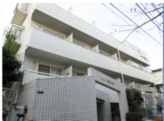
【タイル張りの外観】