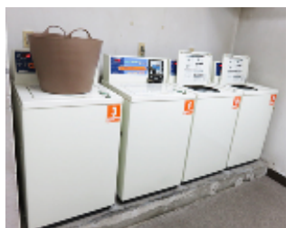
【ランドリールーム】

★2路線3駅利用可★ 都営三田線 新板橋駅 徒歩9分 JR埼京線 板橋駅 徒歩13分 都営浅草線 西巣鴨駅 徒歩13分